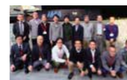
第28期 (2017年度) 修了生

講師の言っていた「自分の軸」がまだ途中ではあるが見えてきた／「本当に人間力で経営をした人」に出会えた／自分の考えは間違いではないと確信し、腹が決まった／社内の小さな世界で凝り固まっていたことに気づけた／同じ事象を違う切り口で考えると、違う答えが出てくる面白さを体感できた／価値は「教えてもらったこと」より「考えるきっかけをもらったこと」と「素晴らしい仲間ができたこと」／この仲間と一緒に何か新しい事業や仕事をしたいと心から思えた／「裸の付き合い」ができる仲間ができた／自分は「偉くなりたくない」人間だったが、毎月の経営的な議論でようやく「覚悟」ができてきた／常に「経営者だったらどう考えるか」というくせがついた